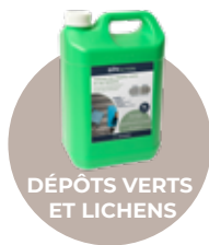
DÉPÔTS VERTS ET LICHENS