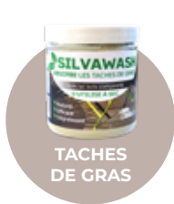
TACHES DE GRAS