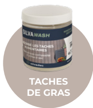
TACHES DE GRAS