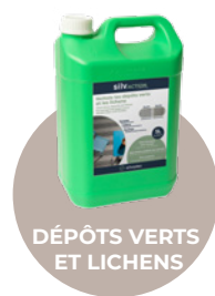
DÉPÔTS VERTS ET LICHENS